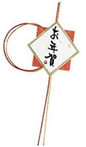
= 令和2年最初の安全会議です =