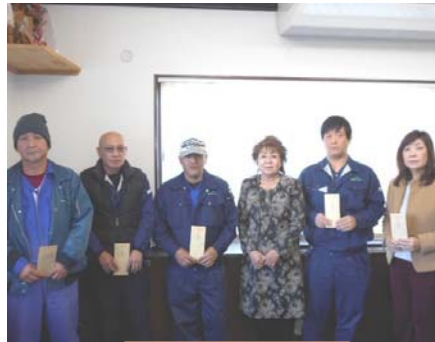
皆勤賞 表彰 (受賞者 6人)